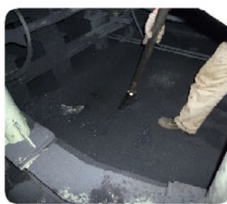
グリス混じり粉塵の吸引