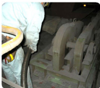
装置周りの吸引作業

使用状況に合わせてバブロンをシリーズ化していますので、一般の工場や建設現場等でも粉塵の清掃にお困りの場合は、お気軽にお問い合わせください。