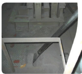
クレーン上の粉塵