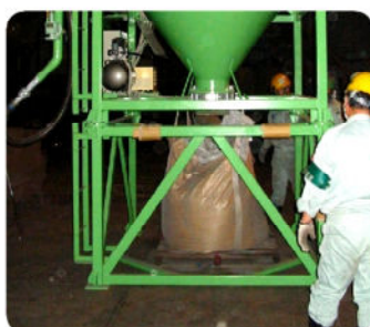
粉塵はフレコンへ