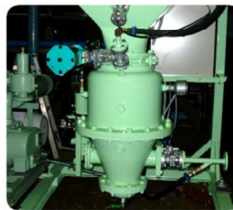
吹込機で電気炉へ